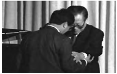
图：2002 年 10 月，江泽民以私人身份访美时，被法轮功学员在芝加哥以群体灭绝罪、酷刑罪、反人类罪告上法庭，江泽民接到控告状时惊慌失措。

◆ 2012 年 10 月 30 日“清算江泽民迫害法轮大法国际组织”发布成立公告，将开始彻底清算江泽民流氓集团、“六一零办公室”以及直接实行迫害的公、检、法组织和在劳教所、洗脑班、监狱的管教人员与恶警，以及丧尽天良的活摘法轮功学员器官的所谓医生等。