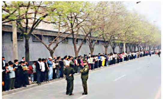
图：1999 年 4 月 25 日上访现场，法轮功学员文明安静，警察不用维持秩序，在一旁聊天。所谓的“围攻中南海”根本就不存在。

中共无视人民的基本权利，将 1999 年 4 月 25 日法轮功学员到中共国务院信访局群体上访诬蔑为“围攻中南海”。中共对向国家机关写信反映法轮功真实情况并表明个人身份的法轮功学员，以及直接到信访部门上访的法轮功学员，采取非法的抓捕、直接或遣送回原籍非法拘留、罚款、劳教以至判刑。中共利用国家暴力对公民的批评、建议和申诉、控告、检举权的侵犯和剥夺，造成人民有冤无处申的巨大痛苦，也使社会矛盾大量积累，使整个社会面临着全面的动荡和崩溃。