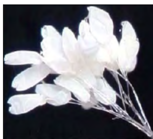
▲优昙婆罗花放大图

佛经记载，“优昙花者，此言灵瑞，三千年一现”（《法华文句》），当金轮王（转轮圣王）下世传法时，这天界奇花会在人间绽放。今天，奇花绽放，这天降祥瑞在晓谕世人：圣王已然下世，正法已经开传。