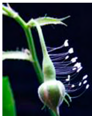
▲ 从2007年优 昙婆罗花连续四年在 东营、胜利油田盛开。