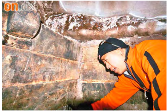
▲探索队员在木结构方舟内

2010 年 4 月 28 日，一支由香港人和土耳其人组成的探索队在北京宣布，他们日前在土耳其东部的亚拉腊山（《圣经》记载的阿勒山）海拔超过 4000 米处发现了诺亚方舟遗迹，并成功进入巨型木结构的方舟内，探索队员还在方