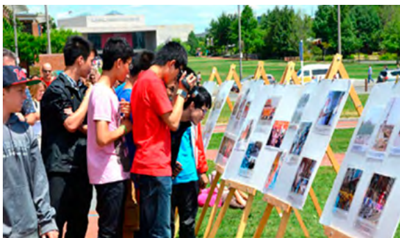
▲ 美国自由钟独立宫广场，来自中国大陆的游客阅读、拍摄介绍法轮功和反迫害内容的真相展板。

在英国剑桥国王学院门前，一位访问学者用真名声明退党后说：“因为你们法轮功太正了，共产党容不下！”