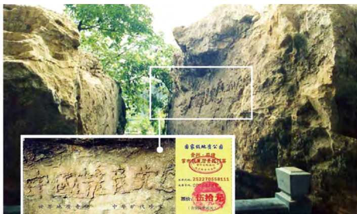
▲上图为“藏字石”照片，小图为风景区门票。

高崖上落下来，断成两块，字在右边那块巨石上，清晰可辨。又经鉴定，这些字都是天然形成的，没有任何人为加工的痕迹。当时国内一百多家媒体，