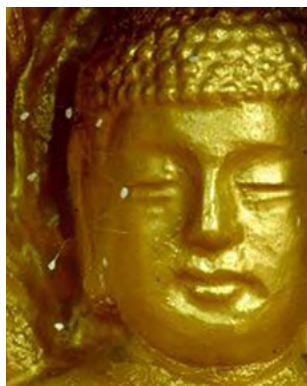
▲ 2005年韩国须弥山禅院佛像面 部开放的优昙婆罗花