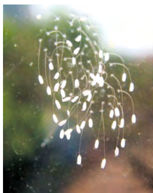
▲ 2008年青岛 早报报道的开在玻璃 上的优昙婆罗花