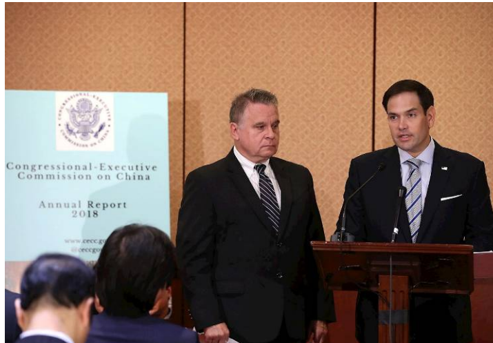
■十月十日，美国联邦参议员、“美国国会及行政当局中国委员会”主席卢比奥（右）和“美国国会及行政当局中国委员会”共同主席史密斯公布美国会人权报告

非政府组织“对华基金会”在中共司法数据库中发现，二零一七年有八百人被判刑，其中大部份是法轮功学员。报告说，中共当局继续使用法律之外的行政手段进行任意拘禁。中共继续使用“利用×教破坏法律实