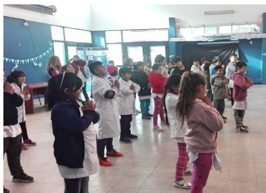
■二零一八年七月十三日，布宜诺斯艾利斯法轮功学员在索拉诺镇的一所学校教授孩子们法轮功功法。

阿根廷首都所在的布宜诺斯艾利斯省的索拉诺镇一所学校的校长，不久前参加了省文化和教育单位的教师和负责人的培训。该培训旨在让全省五十个学区的两千所学校自愿联合起来，共同合作，改善学生的学习。培训中播出了乌拉圭一所学校如何从法轮功