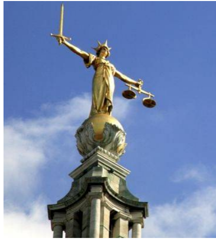
■ 伦敦老贝利大楼屋顶上的正义女神雕像

“独立人民法庭”是在“终止中共移植滥用国际联盟（ETAC）”的倡议下成立的。ETAC 的主席温迪·罗杰斯教授说：“要解决这样大规模的犯罪问题，国际社会需要