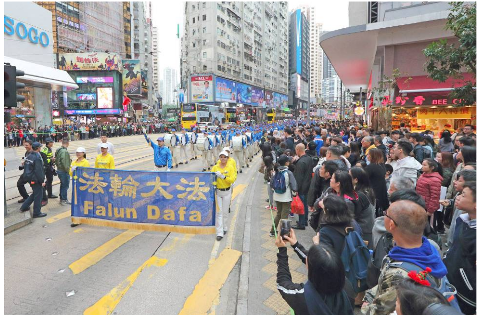
■ 2018 年国际人权日前夕，香港法轮功学员在政府总部前的“公民广场”举行反迫害集会游行。盛大场面震惊大陆游客，纷纷拍照留念。