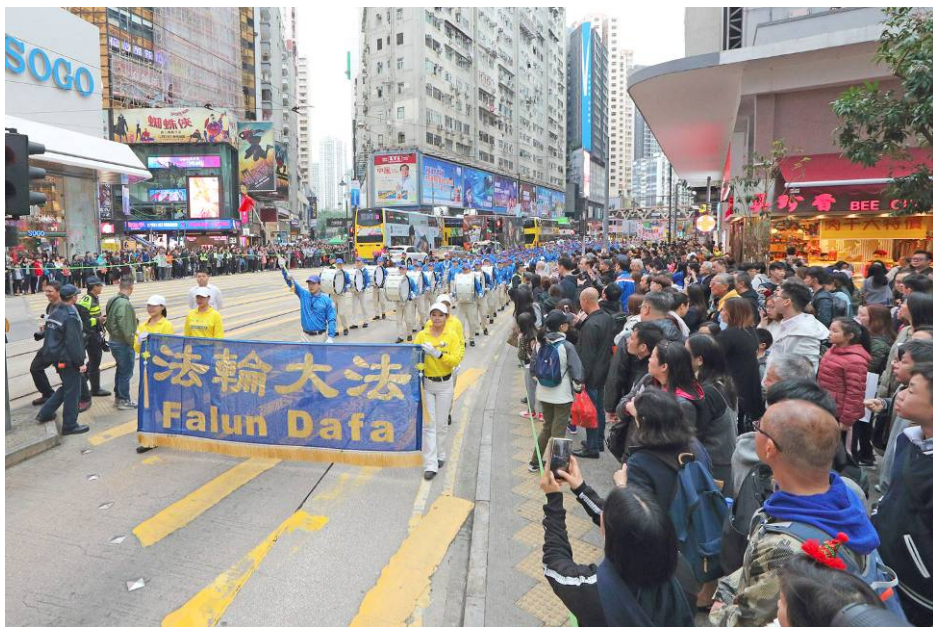
■ 2018 年国际人权日前夕，香港法轮功学员在政府总部前的“公民广场”举行反迫害集会游行。盛大场面震惊大陆游客，纷纷拍照留念。