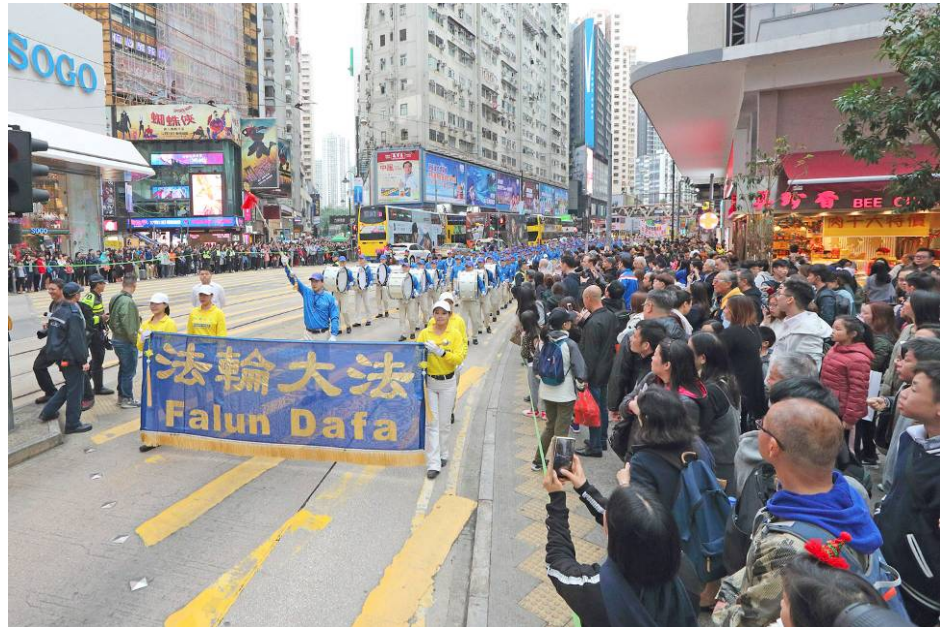
■ 2018 年国际人权日前夕，香港法轮功学员在政府总部前的“公民广场”举行反迫害集会游行。盛大场面震惊大陆游客，纷纷拍照留念。