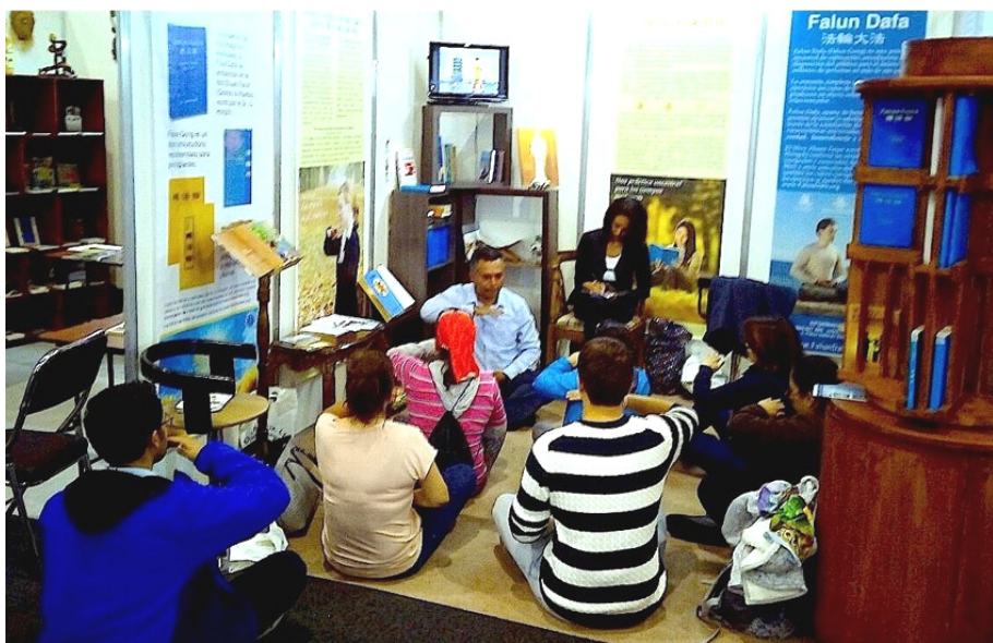
■在书展上，络绎不绝的人群来到法轮功展台参观学炼功法

来到法轮功展台，炼完功后，他告诉学员：“我过来的时候，就看见法轮功展台有能量在转动，这种机会可遇而不可求，所以我马上学炼功法。我近几年一直在寻找修炼的机缘，非常感谢你们！”