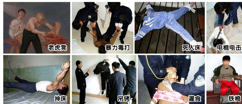
▲ 中共迫害法轮功学员酷刑示意图。

从1999年迫害至今十六年，抄了我多少次家都记不清了，抢走多少东西也记不清了，每次抄家先绑架人，后抢东西。每次抄家吓得邻里不安，家中老小更是又气又怕，精神受到严重伤害。