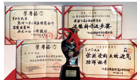
▲ 李洪志大师荣获 1993 年健康博览会“边缘科学进步奖”和“受群众欢迎气功师”称号。

此前，1992 年的北京东方健康博览会上，“法轮功神了”的消息就在参观的人群中传开了。博览会总指挥李如松说：“收到表扬信最多的是法轮功。”总顾问姜学贵教授说：“我亲眼看到李洪志老师为这次博览会创造了很多奇迹……我作为博览会的总顾问，负责任地向大家推荐法轮功。”在当届博览会，法轮功被誉为“明星功派”，李洪志先生成为获奖最多的气功师。