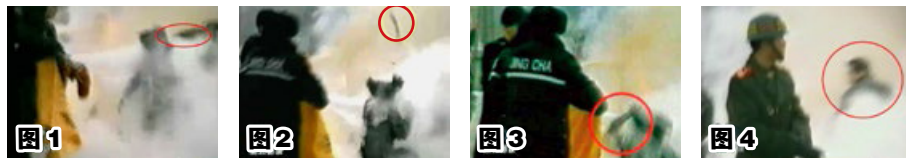
▲ 上图为 CCTV “自焚”录像慢动作分析。

CCTV 镜头显示，刘春玲不是被烧死。1、一手臂抡起，猛击刘春玲的头部；2、重物猛击刘的头部之后弹起；3、刘用手触摸被击打部位，随之倒地；4、一穿大衣的男子站在出手打击的方位，呈现着一秒钟前用力打击的姿势。