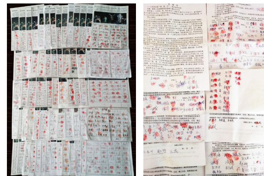
▲ 辽宁凌源 3625 人联名举报江泽民的签名。

2015 年 5 月以来，已有 20 万余法轮功修炼者和家人把控告元凶江泽民的刑事控告状邮寄给中国最高检察院、最高法院，控告江泽民在迫害法轮功中犯下的“群体灭绝罪”、“反人类罪”和“酷刑罪”，并要求将其绳之以法。