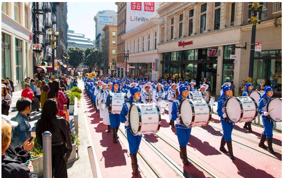
■上：法轮功学员参加美国纽约法拉盛新年大游行，观众高喊“法轮大法好”。