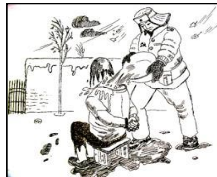
■中共酷刑示意图：浇凉水