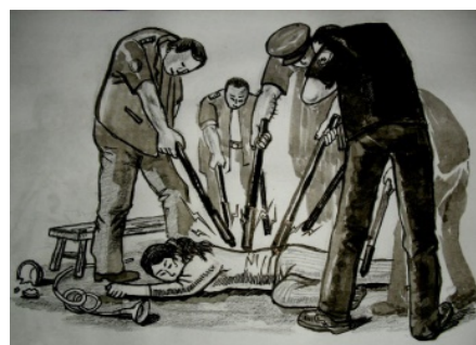
■中共酷刑示意图：多根电棍电击