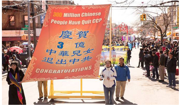
图：2018 年 3 月 11 日，近千名法轮功学员来到纽约第三大华人社区布碌伦第八大道举行盛大游行，传递“法轮大法好”，“天要灭中共，三退保平安”的天机。游行当日，有四十六人退出中共党、团、队，一百六十六人退出中共共青团、少先队，三百四十九人退出中共少先队。

王女士继续给他讲：“我是为你好才打这个电话，告诉你一条自救的路，将来不要做替罪羊。其实早期的北京公安局局长刘传新的深刻教训你们最清楚，要知道中共历次的运动都是公检法的人做替罪羊，你回过头去看看每次运动平反后是不是公检法的人最惨，所以你要