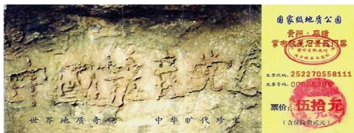
图: 2002 年 6 月在贵州发现的“藏字石”断面上显现“中國共產黨亡”六个大字, 昭示着“天灭中共”的天意。

因为中共罪大恶极，当上天要惩罚它时，如果没有声明退出中共党、团、队组织（三退）的人，就会被上