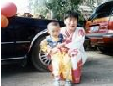
어린 영학과 엄마

본래 행복하고 미만했던 한 가정이 선량한 사람을 탄압하는 장쩌민이 발동한 이 한차례 박해운동에 의해 이렇게 박산 났다.