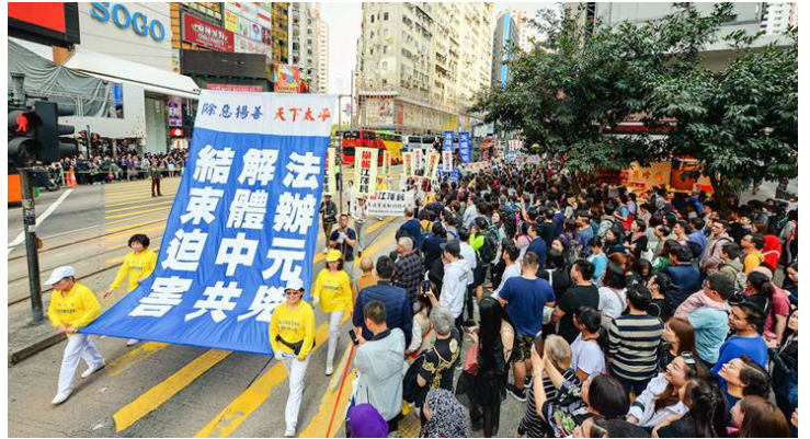
图：2018年3月18日香港法轮功学员举行游行活动声援近三亿人“三退”，吸引许多香港市民和大陆游客驻足观看。

官方数据显示，截至2017年6月底，中共中纪委共立案审查省军级以上及其他中管官员四百四十人，其中