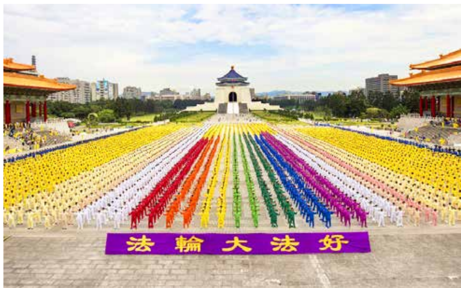
▲ 6000 多名法轮功学员在台北自由广场集体炼功，场面壮观，气势宏大。

法轮功祛病健身、提升道德的效果非常显著，大家一传十、十传百，几年间中国大陆就有1亿人学炼，现已弘传世界100多个国家。目前，法轮功炼功点遍及台湾300多个城镇，几十万人都在修炼法轮功，大量的事实证明，法轮功修炼会给修炼人带来真正的身心健康。◇