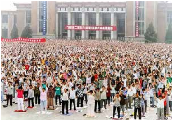
▲ 1998年，辽宁省沈阳市万名法轮功学员在集体炼功。

这么好的功法，我不该让大家都知道吗？法轮功不仅救了我的命，也救了我的家人！我要为法轮大法说句公道话！◇