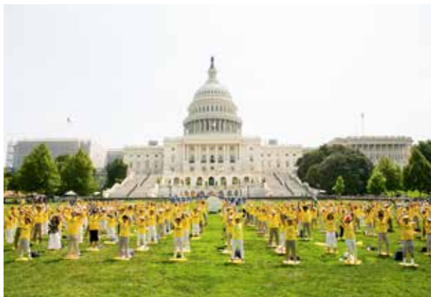
▲ 美国部分法轮功学员在美国首都华盛顿国会山西草坪集体炼功，场面壮观，祥和。

在修炼法轮功之前，对于这位来自美国都市的女医生来说，中国与中华传统文化，是那么的陌生和遥远。是法轮大法这个来自中国的古老修炼功法，让她认识了中华民族文化的美好；是法轮大法让她明白人生真机，获得身心健康，并超越自我，关怀他人，成为有造就的心理医生，福泽她的病患。◇