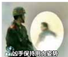
凶手保持用力姿势