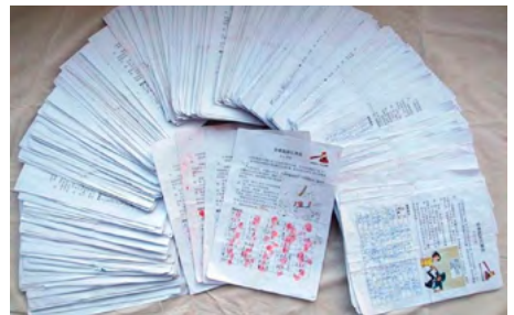
图：2015 年 7 月至 2015 年 12 月，河北省唐山市民众已有二万七千四百六十一人签名支持对江泽民的起诉。

法轮功学员控告江泽民，不仅是作为受害者讨还公道，维护“真、善、忍”普世价值，也是在匡扶社会正义，维护所有中国人做好人的权利。