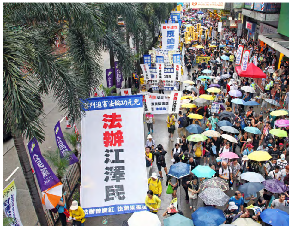
2017年7月1日香港法轮功学员参加反迫害大游行。