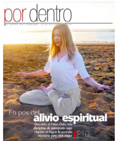
修炼法轮大法使人达到更美好的境界

《新的日子》记者报道说，法轮大法，一种源自于古老中国的修炼方法，目的是改善人们的身、心、灵各个层面，有一亿人都在学这项能够促进身心健康的东方修炼。这个功法巨大的力量影响了全人类。