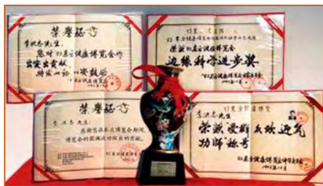
▲ 1993年北京东方健康博览会上，李洪志先生荣获博览会最高奖项“边缘科学进步奖”。

◆ 如今，法轮大法已弘传世界一百多个国家和地区，使全球上亿人身心受益。国际社会鉴于李洪志师父和法轮大法对人类身心健康作出的杰出贡献，纷纷颁发各项褒奖、支持议案和支持信函3500多项，各国、各地政府和团体组织纷纷宣布“法轮大法月”、“法轮大法周”和“法轮大法日”来支持法轮大法。同时李洪志先生还获得“全球百大在世天才”、“杰出精神领袖奖”等多项世界性荣誉。