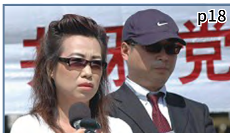
皮特和安妮公开指证中共大规模活摘法轮功学员器官牟利的滔天罪恶