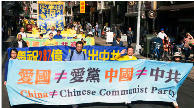
2017年10月22日法轮功学员在曼哈顿中国城游行。

马克思生长于德国，而且在柏林大学学习黑格尔哲学，深受黑格尔哲学影响。所以在马克思主义中，没有个人的自由和权利是自然的。和黑格尔不同的是，马克思主义用“党”取代了国家成了“上帝”