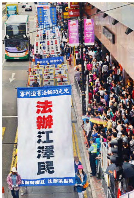
2017年4月23日香港法轮功学员集会游行，纪念4·25法轮功学员和平上访十八周年。

法轮功学员控告江泽民，不仅是作为受害者讨还公道，维护“真、善、忍”普世价值，也是在匡扶社会正义，维护所有中国人做好人的权利。