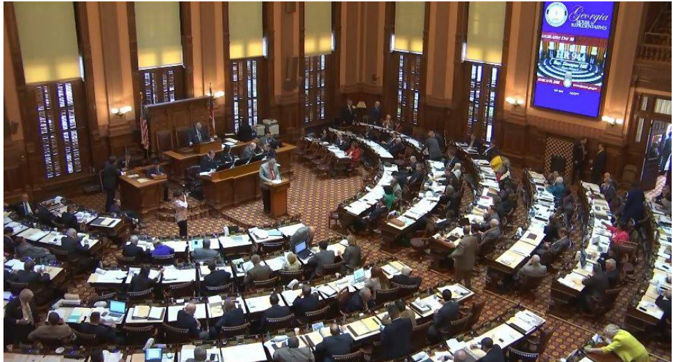
■ 美国乔治亚州众议院于 2018 年 3 月 19 日一致通过第 944 号决议案。

在此之前的二月十二日，州议会州际政府合作委员会单独为此议案举行了听证会，当地六名法轮功学员应邀发言，其中五名学员作为中共迫害的幸存者，分别讲述了自己曾在