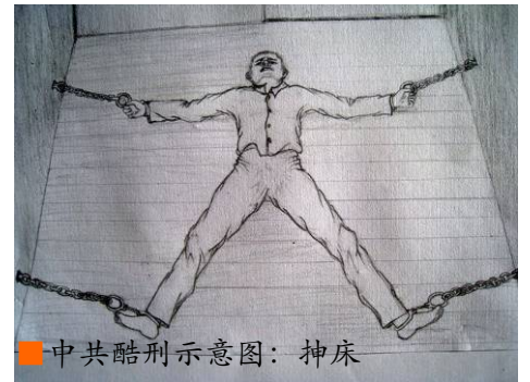
中共酷刑示意图：抻床