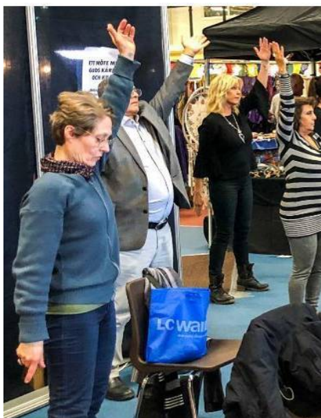
■不少人当场就模仿着台上展示功法的学员，学炼功动作

西人法轮功学员马斯介绍说，“现在从各个渠道了解法轮功真相的人是越来越多了，了解了真相的人们更加认清了中共邪恶的本质。一位男士听了中共活摘器官的事实真相后非常地气愤，他表示用如此残暴的手段对付这些善良无辜的人，那它（中共）一定是邪恶的。” ◇