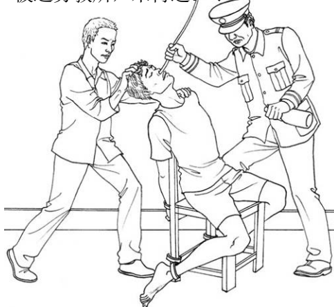
■酷刑示意图：鼻饲灌食