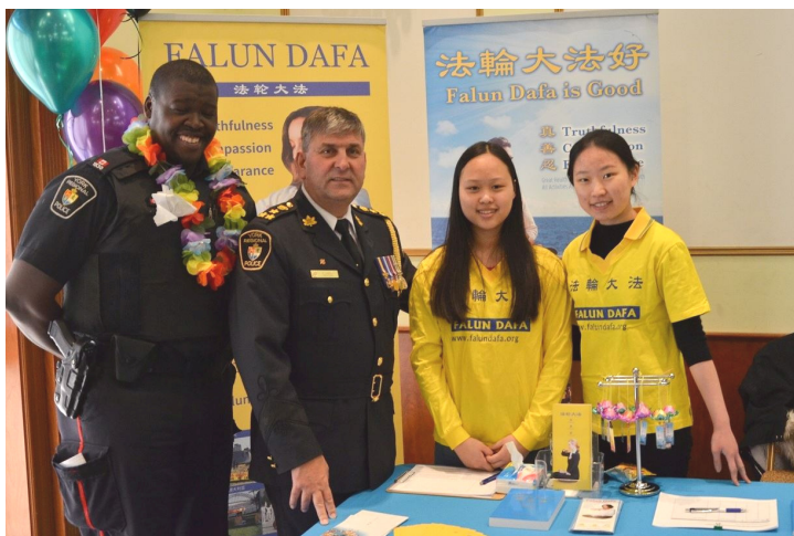
警察总长艾里克·乔里夫（左二）与法轮功学员合影