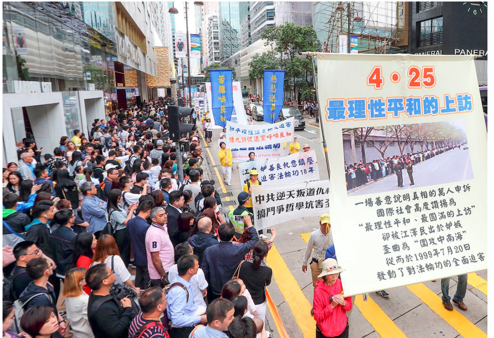
■四月十五日，香港、亚洲多个地区和国家的部分法轮功学员在香港举行纪念“四·二五”十九周年集会游行，场面震撼不少香港市民及大陆游客。

其实，早在1996年，中宣部管辖的新闻出版署，就禁止出版发行当时名列北京十大畅销书的《转法轮》等法轮功书籍（2011年对法轮功书籍的禁令被国家新闻总署50号令废止）。1997年初，罗干指示公安部