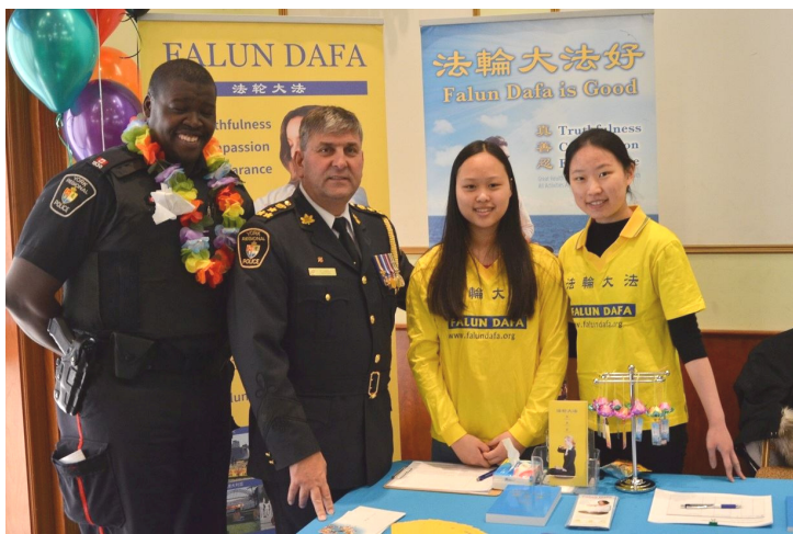
警察总长艾里克·乔里夫（左二）与法轮功学员合影