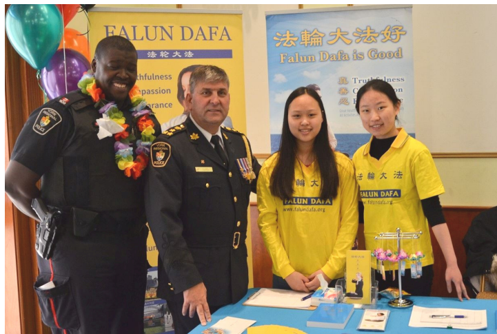
警察总长艾里克·乔里夫（左二）与法轮功学员合影