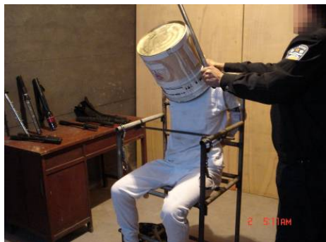
■ 右上：中共酷刑示意图“背铐”； 下：中共黑狱酷刑演示“铁桶敲头”

捕。我被绑架到吉林市公安局警犬基地，被施以酷刑，遭警察殴打，遭受背铐，上大挂、套铁筒（头套上铁筒