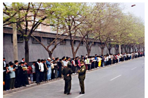
■ 九九年四二五上访现场：法轮功学员们秩序井然，警察放松地闲聊

在过去十九年的时间里，中共的监狱、劳教所、洗脑班等野蛮地折磨法轮功学员，造成至少4213位法轮功学员直接死于酷刑折磨等迫害，而这仅仅是突破消息封锁传出来的案例，实际案例数量远远超过这个数