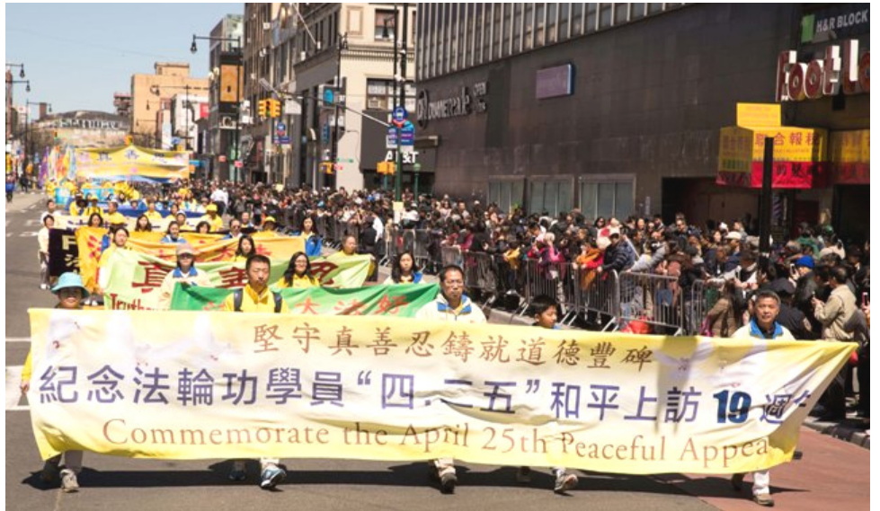
■纪念“四·二五”和平上访十九周年，大纽约地区举办盛大游行

他又说，“信仰自由是宪法赋予的权利，但是共产党‘欲加之罪，何患无辞’，发起迫害。共产党看到真、善、忍如芒刺在背，正说明它的本质邪恶。今天人们在海外很容易就看到了法轮功游行。希望有一天这个景象能回归到中国大陆。”