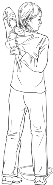
■ 酷刑示意 图：苏秦背剑