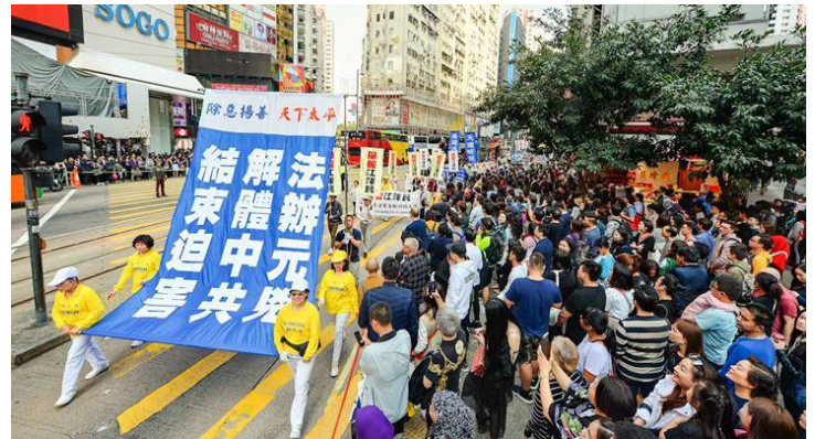
2018년 3월 16일, 홍콩 파룬궁수련인들이 3억 중국인 '3퇴'를 성원하는 행진을 거행해 많은 홍콩시민과 대륙관광객의 발길을 잡았다

정부 통계에 의하면 2017년 6월 말까지 중국공산당 중앙기율검사위원회가 입안 심사한 성군급(省軍級) 이상 및 기타 중간 관리자급 관원이 모두 440명이며, 그중 중국공산당 18기 중앙위원, 후보위원 13명, 중공중앙기율검사위원회 위원 9명, 청국급 관원 8,900