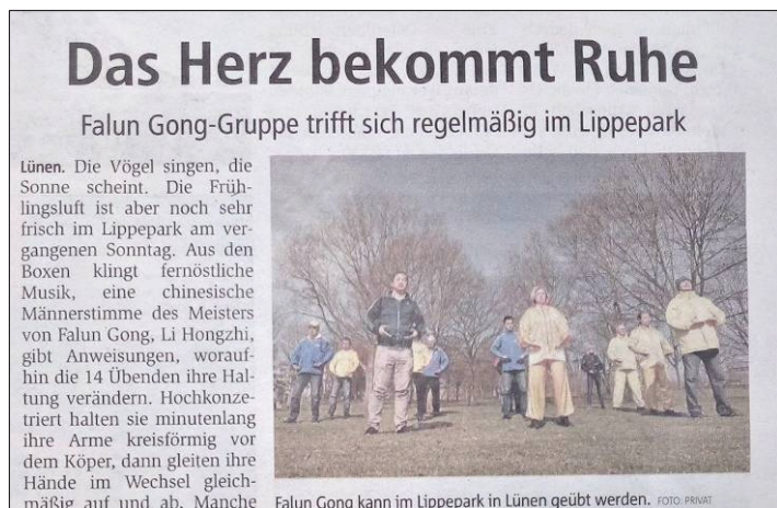
■ 图：三月三十一日，德国《周末信使报》报道法轮功学员在绿嫩市丽波公园集体炼功。

绿嫩市的小鸟在鸣叫歌唱，阳光普照大地，上周日丽波公园的空气格外的清新。小音箱里面传来东方的音乐和一个东方男士，法轮功创始人李洪志的声音，