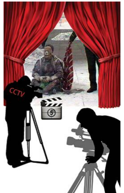
■ 中共导演天安门自焚案

小叔子刚知道我炼法轮功，吓坏了，单独找他哥说，不行，离婚吧。他怕我杀他哥和孩子，更怕影响他们的前程，俩口子跟我大喊大叫，不让我炼，说他们的所长因炼法轮功被迫害死了。在后来的接触中，他们看到我的变化：经常看到我去看公婆，直到婆婆去世，买墓地，我们拿了大部