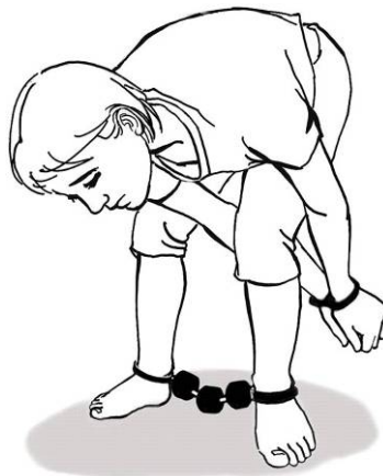
■ 酷刑演示：手铐脚镣

我每天 24 小时被强制戴脚镣和手铐，不准下床活动。由于我要求上诉，双手曾被一字型铐在床上 20 多