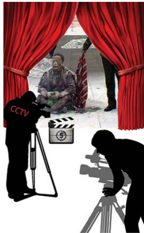
■ 中共导演天安门自焚案

小叔子刚知道我炼法轮功，吓坏了，单独找他哥说，不行，离婚吧。他怕我杀他哥和孩子，更怕影响他们的前程，俩口子跟我大喊大叫，不让我炼，说他们的所长因炼法轮功被迫害死了。在后来的接触中，他们看到我的变化：经常看到我去看公婆，直到婆婆去世，买墓地，我们拿了大部