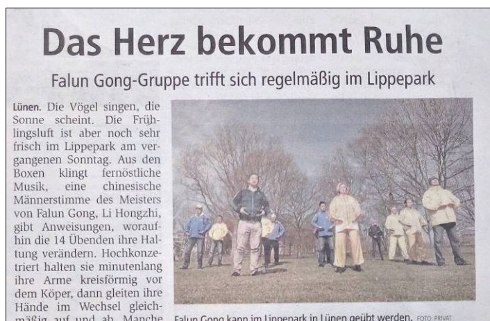
■ 图：三月三十一日，德国《周末信使报》报道法轮功学员在绿嫩市丽波公园集体炼功。

绿嫩市的小鸟在鸣叫歌唱，阳光普照大地，上周日丽波公园的空气格外的清新。小音箱里面传来东方的音乐和一个东方男士，法轮功创始人李洪志的声音，