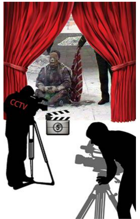
■ 中共导演天安门自焚案

小叔子刚知道我炼法轮功，吓坏了，单独找他哥说，不行，离婚吧。他怕我杀他哥和孩子，更怕影响他们的前程，俩口子跟我大喊大叫，不让我炼，说他们的所长因炼法轮功被迫害死了。在后来的接触中，他们看到我的变化：经常看到我去看公婆，直到婆婆去世，买墓地，我们拿了大部