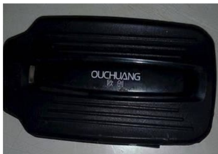
■在法轮功学员的三轮车底部发现的跟踪定位仪

此外，中共还用跟踪定位仪监视法轮功学员。2018年传统新年过后，华北地区一位农村法轮功学员在自家的三轮车底部发现了一台跟踪定位仪。在对法轮功学员的跟踪、监控中，中共采用高科技，手段卑鄙和邪恶。◇