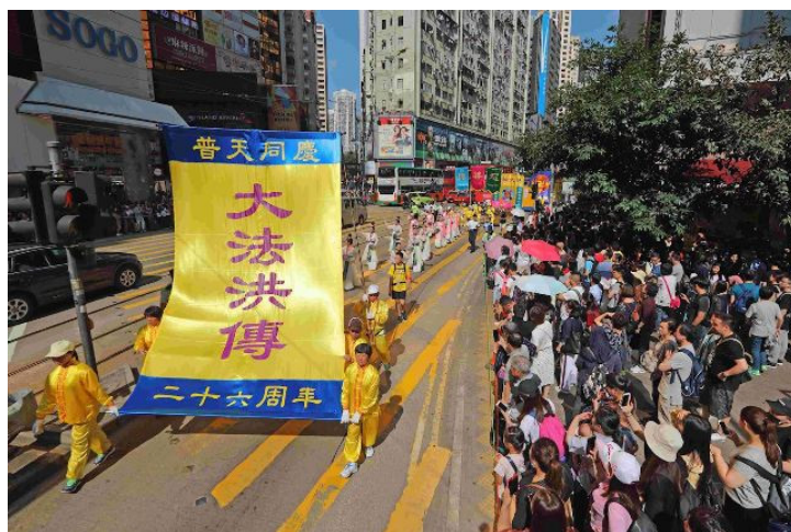
■上图：五月十三日，纽约总督岛公园巨型排字；下图：香港学员恭贺师尊华诞及庆祝世界法轮大法日大游行