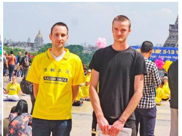
■上：法国法轮功学员在法国巴黎人权广场庆祝法轮大法日，演示功法。