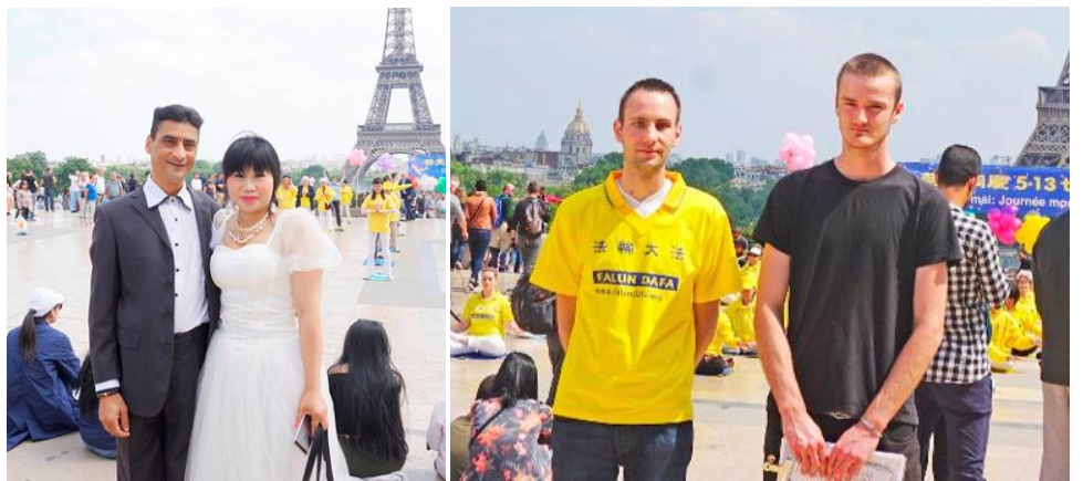
■上：法国法轮功学员在法国巴黎人权广场庆祝法轮大法日，演示功法。