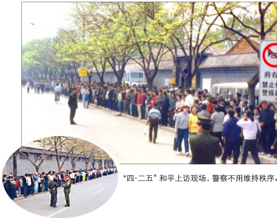
“四·二五”和平上访现场，警察不用维持秩序。