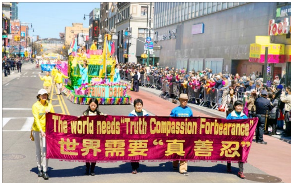
美国纽约大游行纪念“四·二五”和平上访 19 周年