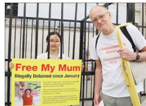
一位伦敦音乐人鼓励法轮功学员晓童

一位伦敦音乐人仔细聆听了法轮功学员被中共迫害的事实之后，写下了：正义必将战胜邪恶。◇