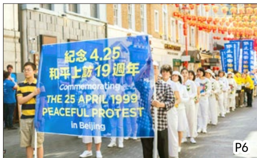
全球多地纪念“四·二五”和平上访 19 周年 (摄于伦敦唐人街, 2018 年 4 月 22 日)