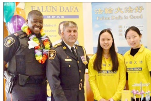
警察总长艾里克·乔里夫（左二）与法轮功学员

活动当天，约克区警察总长艾里克·乔里夫以及各级政府官员前来支持。警长来到法轮功的展位，与每个法轮功学员握手问候：“欢迎你们！谢谢你们！”警局督察瑞奇·维若潘先生说：“我们的职责是保护我们的社区、保护你们的权利、保护你们的信仰。法轮功在加拿大是受到保护的。”◇