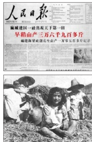
“压不倒的稻子”与“烧不坏的雪碧瓶”

◎ 前三十年是砸孔庙，破坏传统文化；后几十年是修孔庙，因为孔庙可以发展旅游经济来捞钱，糟蹋传统文化。