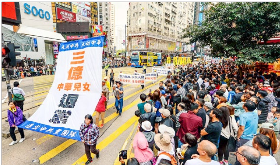
2018年3月18日，香港法轮功学员大游行，祝贺3亿中国人理智地选择未来。