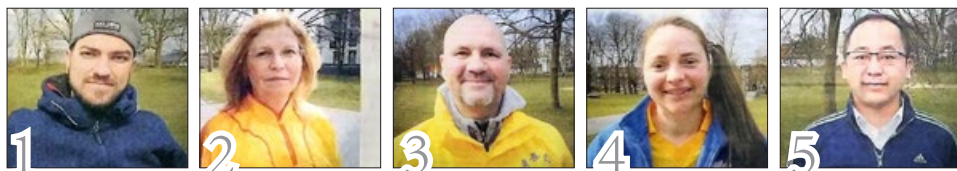
德国《鲁尔日报》报道法轮功并采访五位法轮功学员