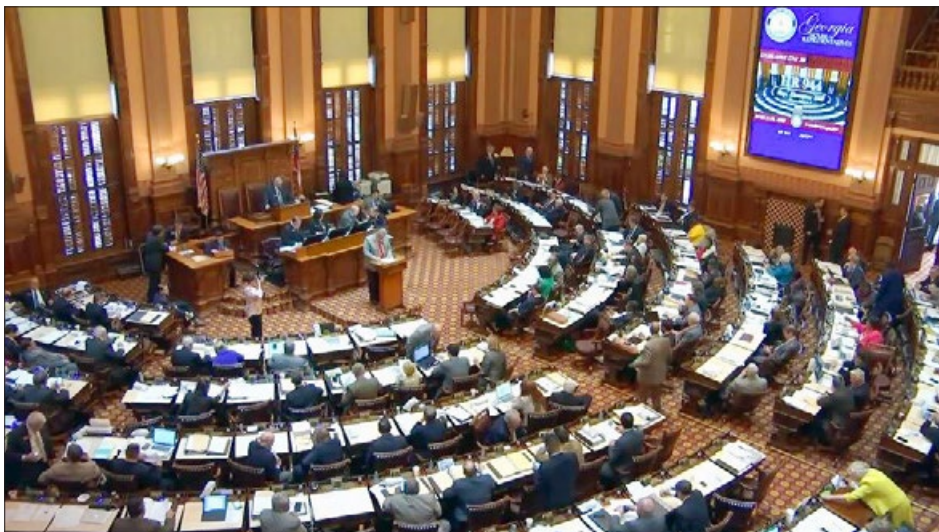
美国乔治亚州众议院一致通过 944 号决议案