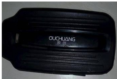
在法轮功学员的三轮车底部发现的跟踪定位仪

此外，中共还用跟踪定位仪监视法轮功学员。2018 年传统新年过后，华北地区一位农村法轮功学员在自家的三轮车底部发现了一台跟踪定位仪。在对法轮功学员的跟踪、监控中，中共采用高科技，手段卑鄙和邪恶。◇