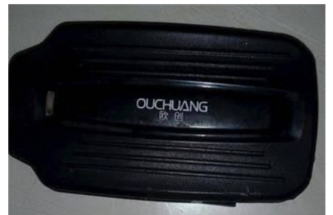
在法轮功学员的三轮车底部发现的跟踪定位仪

此外，中共还用跟踪定位仪监视法轮功学员。2018 年传统新年过后，华北地区一位农村法轮功学员在自家的三轮车底部发现了一台跟踪定位仪。在对法轮功学员的跟踪、监控中，中共采用高科技，手段卑鄙和邪恶。◇