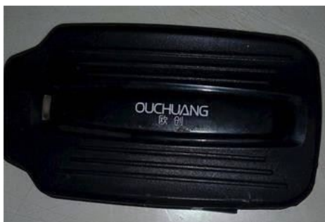
■在法轮功学员的三轮车底部发现的跟踪定位仪

此外，中共还用跟踪定位仪监视法轮功学员。2018年传统新年过后，华北地区一位农村法轮功学员在自家的三轮车底部发现了一台跟踪定位仪。在对法轮功学员的跟踪、监控中，中共采用高科技，手段卑鄙和邪恶。◇