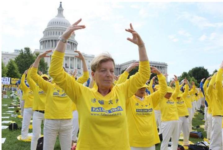
■法轮功学员在美国国会西草坪上集体大炼功

欢所有的横幅，特别是揭露共产主义的邪恶本质的。因为我出生在古巴，它曾是个自由的国家。如今它被暴徒、共产主义当局统治。它粉碎人权，并践踏新闻及各种自由。当你们说，共产主义的邪灵在统治我们的世界，及共产主义的终极目的是毁灭人类，我从我的个人经历知道这是真的。”