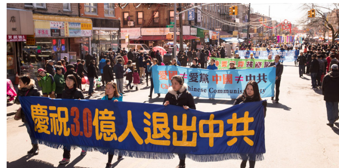
▲ 2018年，美国纽约法轮功学员在布碌仑举行盛大游行