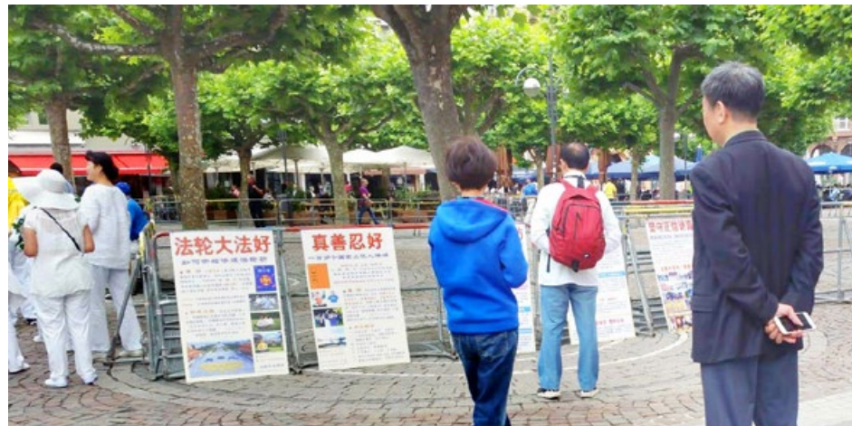
在法兰克福市中心，中国游客阅读法轮功真相展板。