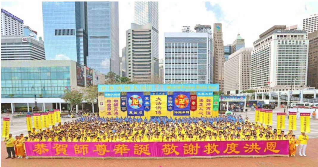
香港中环爱丁堡广场上的集会，庆祝法轮大法传世 26 周年。