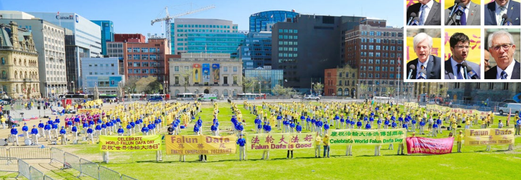
加拿大国会议员们来到法轮功学员的庆典现场表示支持。