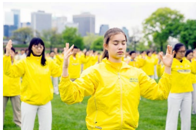
参加排字活动的法轮功学员，在纽约总督岛炼功。