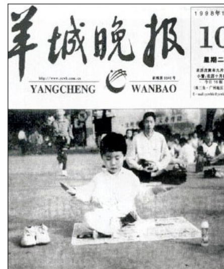
羊城晚报1998年11月10日报道《老少皆炼法轮功》：广东省体委武术协会有关领导，观看了5000法轮功爱好者的晨练活动。炼功者来自各行各业，年龄最大的93岁，最小的两岁。