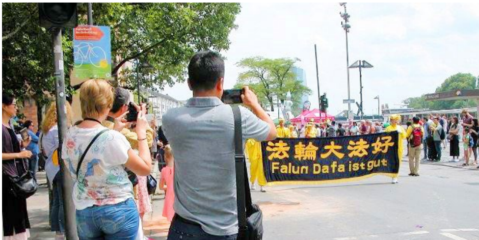
德国法兰克福文化节，民众拍摄法轮功队伍。（2018年6月16日）