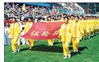
亚洲体育节上法轮功的盛况。中国青年报1998年8月以《生命的节日》报道法轮功祛病健身，提升道德的事例。