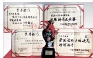
1993年北京东方健康博览会，法轮功获最高奖“边缘科学进步奖”和大会“特别金奖”。