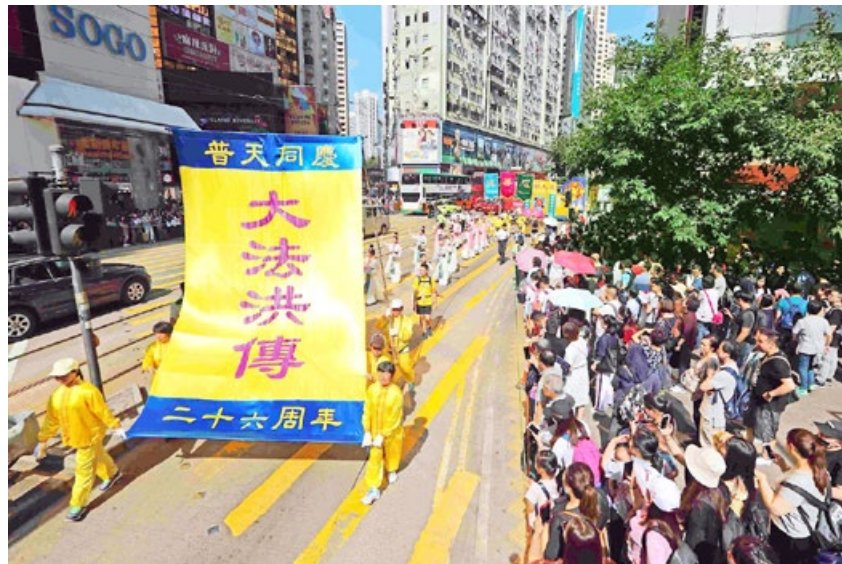
香港大游行，沿途民众深受震撼。