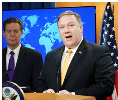
美国国务卿蓬佩奥在新闻发布会上

【明慧网】2018年5月29日，美国国务院发布2017年度《国际宗教自由报告》，中国再次被列为“特别关注国”。报告关注法轮功、基督教等信仰团体受迫害情况。美国国务卿蓬佩奥表示，美国对于侵犯宗教自由的行径不会袖手旁观。