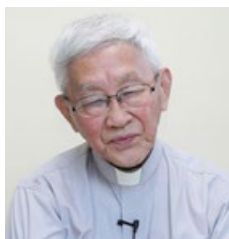
天主教香港教区荣休主教陈日君枢机

天主教香港教区荣休主教陈日君枢机表示，法轮大法有益于身体健康，香港和世界其它国家地区都有很多人学炼法轮大法。很可惜在中国大陆发生对法轮功的迫害，他说：“我们很欣赏法轮功学员都是以非常和平理性的方式坚持其良善的行动，世界上越来越多人欣赏法轮功为个人与社会带来的好处。”