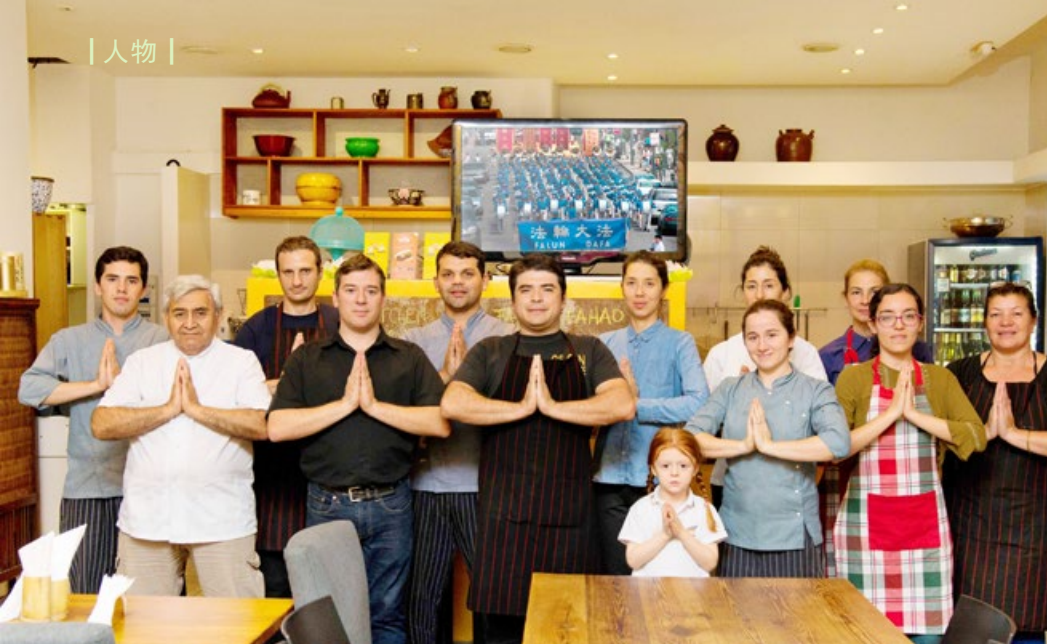
餐厅的员工们在 2018 年法轮大法传世 26 周年之际感谢师父