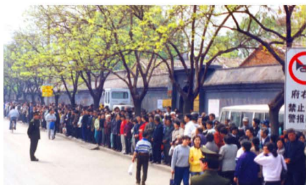
▲ 上万名法轮功学员在信访办外和平上访，静静伫立。

1999年4月25日，上万名法轮功学员到国务院信访办和平上访，反映发生在天津的公安暴力抓捕法轮功学员事件，时任总理朱镕基与法轮功学员见面并初步解决了问题，天津被抓的法轮功学员获释。江泽民出于妒忌，于25日晚强行推翻政府总理的开明决定，把和平上访歪曲成“围攻中南海”，并于1999年7月公开迫害法轮功。