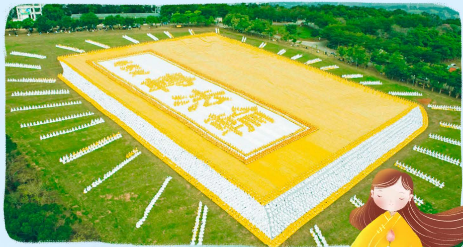
▲ 6000多名法轮功学员在台湾台中市外埔乡排出《转法轮》一书的立体画面，极为壮观。

法轮大法已弘传100多个国家和地区，受到世界人民的爱戴和尊敬。李洪志先生和法轮大法因对人类身心健康做出的杰出贡献，获各国政府褒奖、支持议案和信函3500多项。《转法轮》已经有40种文字版本，是迄今为止翻译成外国文种最多的中文书籍，可在法轮大法网站（ falundafa.org ）上免费下载。