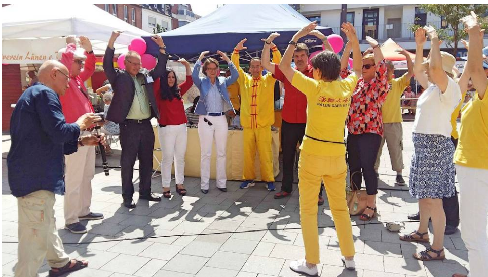
■德国的六名政治家和法轮功学员一起炼第二套功法法轮桩法。

六名官员们和法轮功一起炼了法轮功的第二套功法：法轮桩法，法轮桩法属于静功，由四个抱轮动作组