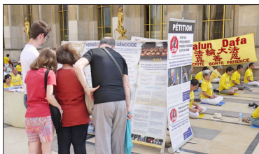
图：法轮功学员反迫害 19 周年之际，2018 年 7 月 22 日，法国巴黎人权广场，法轮功学员举行炼功、讲真相活动，游客观看真相展板，签名支持法轮功。