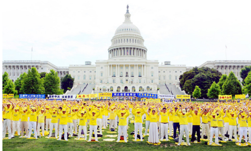
封面：反迫害 19 年 磨难中铸就辉煌 (摄于美国首都华盛顿国会山)