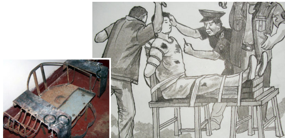
中共迫害法轮功学员的刑具：铁椅子