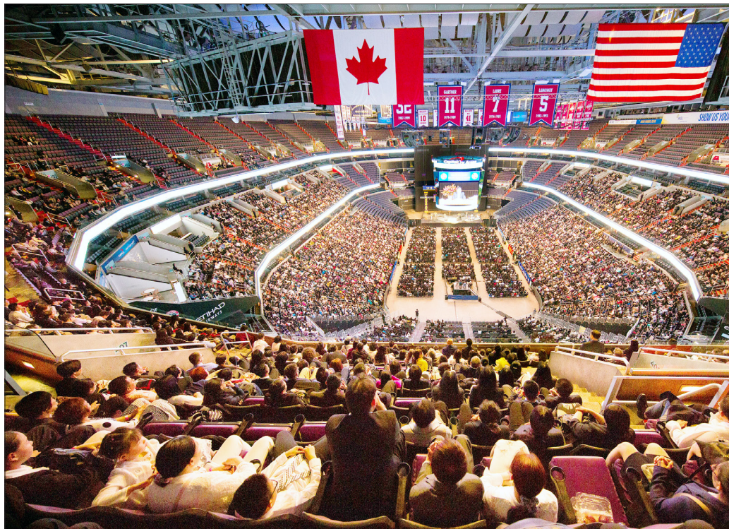
图：来自世界 56 个国家和地区的近万名法轮功学员，到美国首都参加“法轮大法修炼心得交流会”。（摄于 2018 年 6 月 21 日，华盛顿 Capital One Arena 室内体育场）