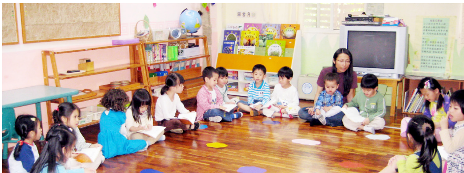
以“真善忍”原则育人，让家长放心。图为台湾明慧豆豆园。