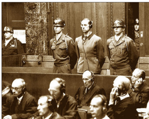
纳粹医生卡尔·勃兰特（两军警间站立者） 被纽伦堡国际法庭判处死刑

面对控诉，纳粹医生们辩解他们只是遵从命令。然而“服从命令”的借口，不能开脱他们的滔天罪恶。1963 年，针对纳粹集中营的中下层军官，德国又进行了法兰克福审判，审判原则很简单：服从上级命令即谋杀共犯。“服从命令”与“未亲手杀人”不再是洗脱罪责的借口。