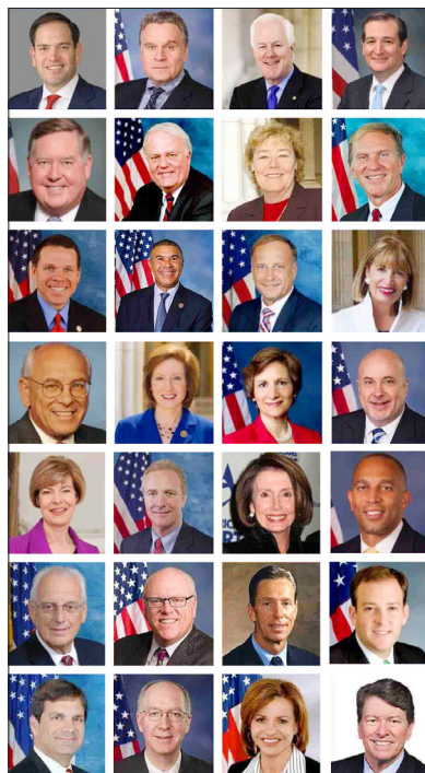
图：28位美国国会议员致信支持法轮功

2018年6月20日上午，法轮功学员及支持者在首都华盛顿国会山西草坪集会，十多位美国国会议员和非政府组织代表参加，声援法轮功学员和平反迫害，至少28位美国国会议员致信支持法轮功。