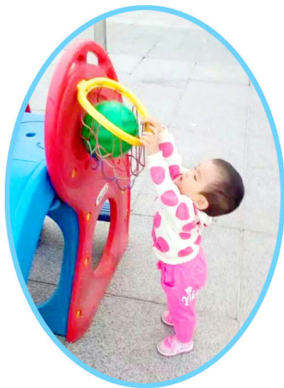
图：1岁多的外孙女彻底康复了

【明慧网】2015年1月6日，我的大女儿在当地医院进行剖腹产，因她的子宫和卵巢都有瘤，剖腹产后大出血，急需输血时才发现血型不对。原来是医院疏忽，把我女儿的Rh阴性血，化验成了Rh阳性血。女儿这种血型大约一万个人中才有一个人。