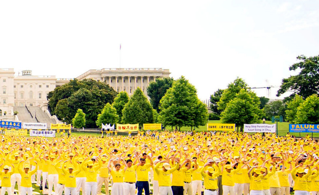
图：2018 年 6 月 20 日，数千名来自世界各地的法轮功学员在美国国会山前集体炼功。

高智晟律师在和法轮功学员接触后，感叹道：“持续地与那些信仰意志坚如磐石的同胞打交道的经历，真切地看到了今日我们民族中最有价值的存在，那一个个微笑着、用平和的语气讲述令人惊心动魄的被迫害过程者，常常感动得我热泪汩汩。我们看到了我们民族中的为了保全心灵中的美好价值而不屈和不死的精神，几年的磨难中，成就了一大批具有无与伦比的高贵人格者，他们对信仰的执著、对野蛮打压的蔑视及对我们民族美好未来的乐观向上的心态，无不至令人仰视的境界。他们对迫害者的宽容襟怀及对我们民族美好明天的乐观心态，使人持久地震撼不已。”