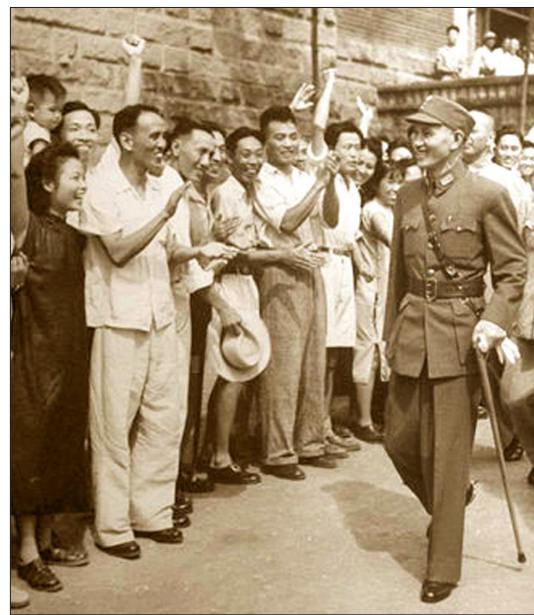
图：蒋介石与重庆市民庆祝抗战胜利

史料显示，国民党是抗日战争的中流砥柱。共产党有意不抗日，并趁国民党抗战，积蓄力量。据战史记载，1937年7月～1945年8月，中日大型会战22次，中方主力都是国民党军队；重要战役1117次，其中共产党打过1次；小规模战斗约30000次，共产党参加约200次。共产党参战的大型战役，只有百团大战，此战在中共内部被认为“违背党的战略方针”。平型关大捷，共产党并不是主力，只是伏击了敌人的补给部队。