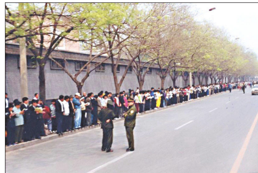
图：1999 年 4 月 25 日和平上访现场秩序井然，警察不用维持秩序，在一旁聊天。