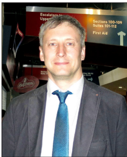
图：欧如普斯已经修炼法轮功 18 年