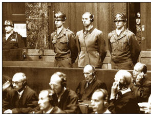
纳粹医生卡尔·勃兰特（两军警间站立者）被判死刑

面对控诉，纳粹医生们辩称他们只是遵从命令。然而“服从命令”不能开脱他们的滔天罪恶。1963年，针对纳粹集中营的中下层军官，德国又进行了法兰克福审判，审判原则：服从上级命令即谋杀共犯。“服从命令”与“未亲手杀人”不再是洗脱罪责的借口。