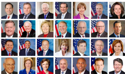
图：28位美国国会议员致信支持法轮功

【明慧网】2018年6月20日上午，法轮功学员及支持者在美国首都华盛顿国会山西草坪集会，十多位美国国会议员和非政府组织代表参加，声援法轮功学员和平反迫害，至少28位美国国会议员致信支持法轮功。