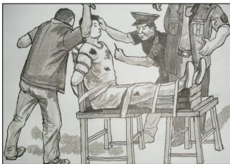
酷刑图示：捆绑、殴打

来就分不清了。一天，我的大脑出现了真正的空白，我非常努力去思考、回忆，但是什么也想不起来，甚至连自己是谁、是否曾经来到这个世界上都想不起来，一种巨大的恐惧使我精神立即崩溃。我大喊大叫着站起来，手铐挣脱开。他们用事先准备好的布条把我捆绑在老虎凳上，嘴里塞上布团。