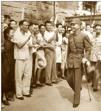
图：蒋介石与重庆市民庆祝抗战胜利