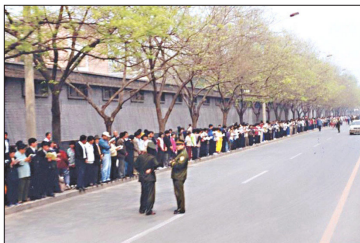
图：1999年4月25日和平上访现场秩序井然，警察不用维持秩序，在一旁聊天。

当时全国的法轮功学员约有一亿人，自发到信访办上访的有一万多人。这样看来，上访的人数并不多。这就是1999年4月25日“万人和平上访”事件。后来被中共江泽民集团歪曲成“围攻中南海”。