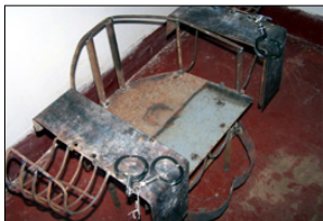
中共迫害法轮功学员的刑具：铁椅子

等等，种种手段，不堪回首。其中，尤以 2012 年沈阳第一监狱对我实施的连续 13 个昼夜的“熬鹰”（不让睡觉）最为恶毒。