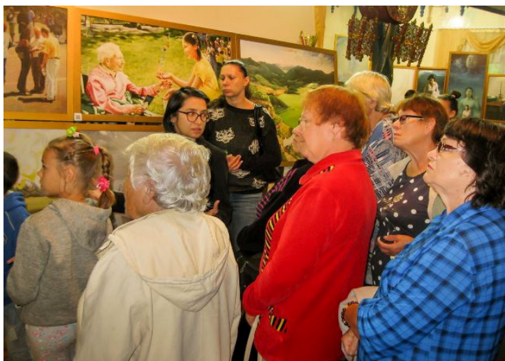
“真善忍”国际美展在俄罗斯布里亚特阿尔山展出

来自乌克兰乌德市的一对夫妇看过画展后，在留言簿上写道：“法轮大法的精神修炼让人升起了最深切的敬意，并让人再一次对生命的意义进行了思考。感谢