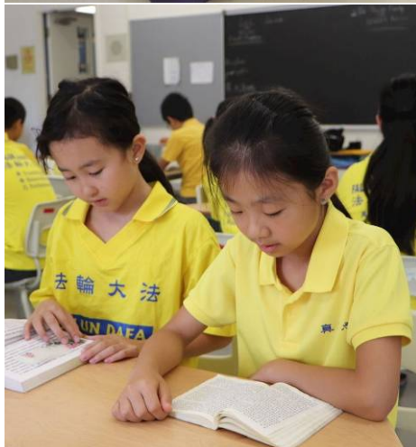
▲ 多伦多明慧学校夏令营的法轮大法小弟子们每天集体炼功