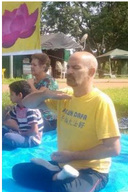
■ 赫里欧在炼法轮功第五套功法

不久前的一天，当我在家炼功时，发现头顶上方有一个法轮。当我有问题时，我在心里询问师父，我能得到所有的答案，我的健康也在恢复。