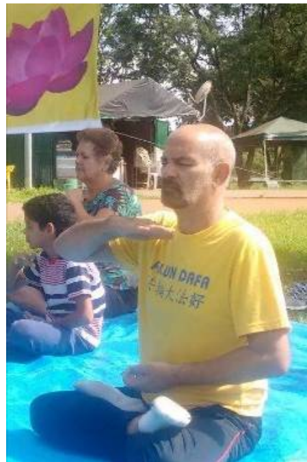
■ 赫里欧在炼法轮功第五套功法

不久前的一天，当我在家炼功时，发现头顶上方有一个法轮。当我有问题时，我在心里询问师父，我能得到所有的答案，我的健康也在恢复。